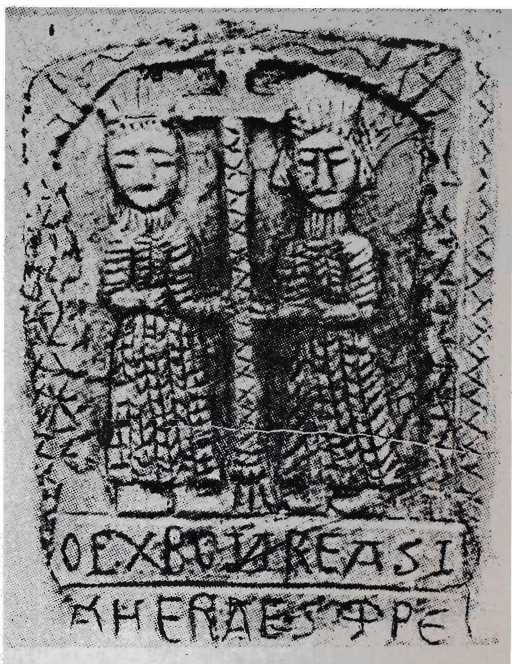
Τό ανάγλυφο άνωθεν τής εισόδου τής έκκλησίας.