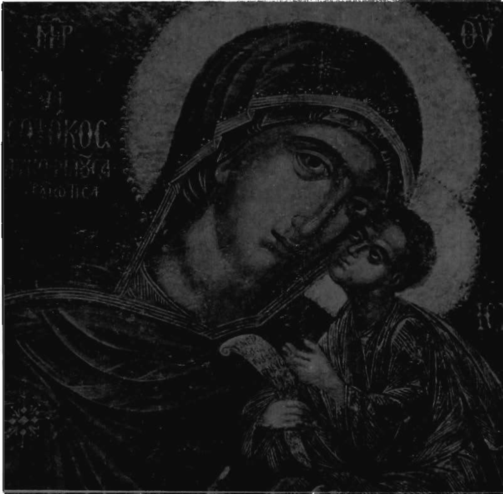
Η ΘΕΟΤΟΚΟΣ ΓΛΥΚΟΦΙΛΟΥΣΑ Η ΚΑΡΔΙΩΤΙΣΣΑ, επί τοῦ τέμπλου τοῦ ἀριστεροῦ κλίτους τοῦ ναοῦ.