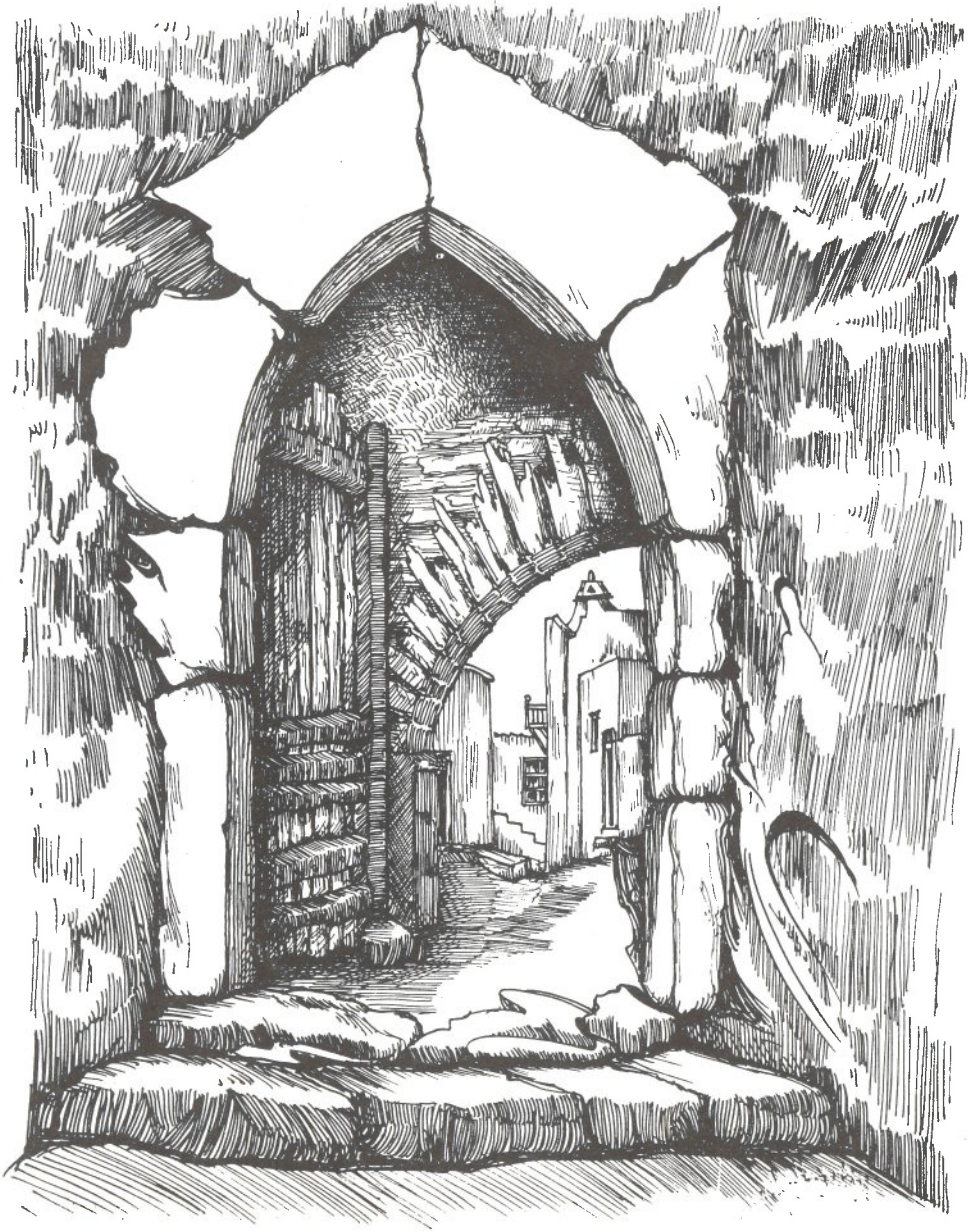
ΝΙΚΟΥ ΚΑΤΣΟΥΡΟΥ: ΝΑΞΟΣ: Η «Τρανή Πόρτα»