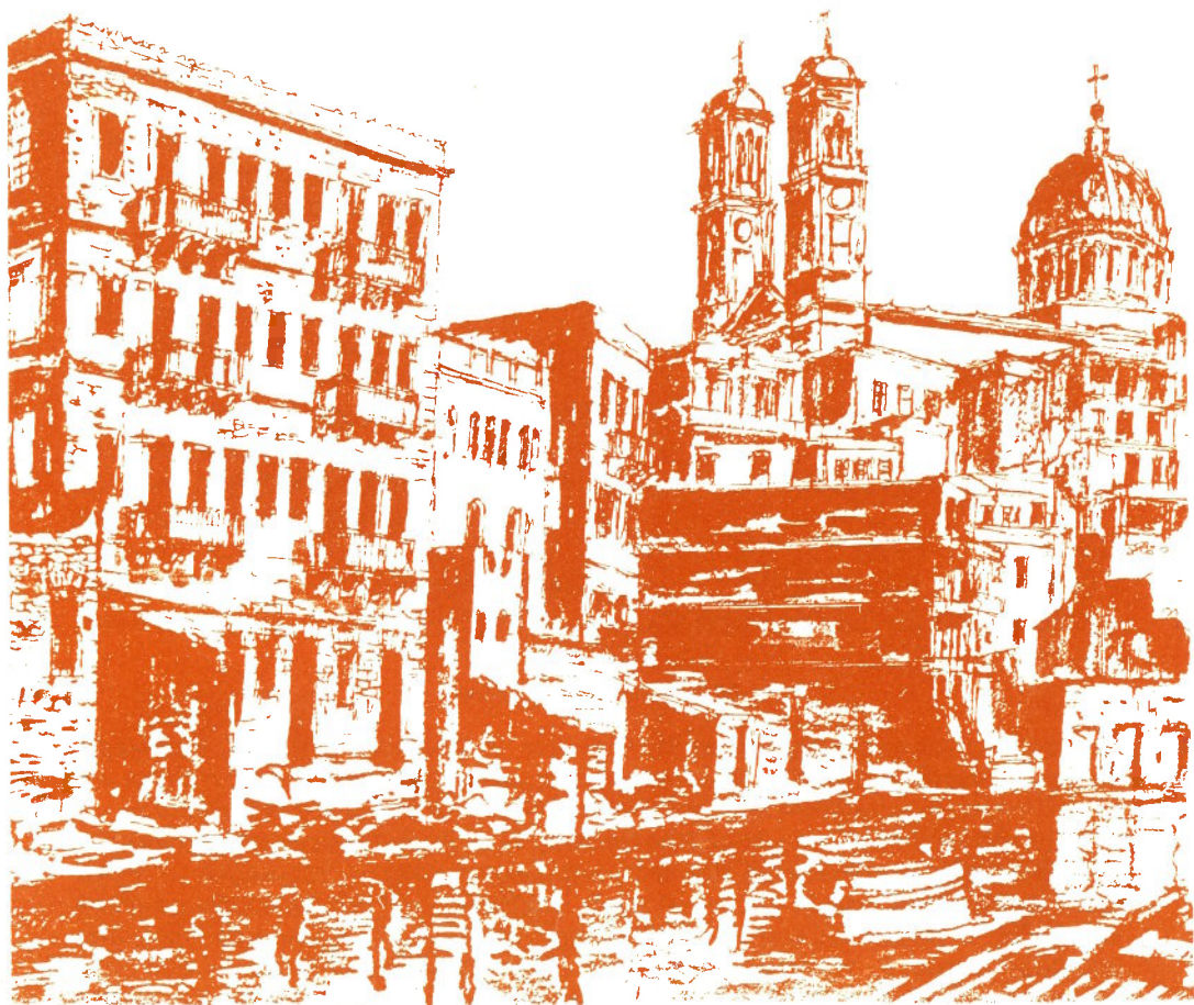
Σύρος, Ερμούπολη. Η συνοικία του Αγίου Νικολάου όπως φαίνεται από τη θάλασσα. (Σχέδιο του αρχιτέκτονα Αλέξανδρου Νικ. Λοΐζου)

— Γράμματα • Ιστορία • Λαογραφία • Πολιτική • Επίκαιρα —